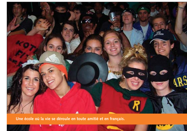
Une école où la vie se déroule en toute amitié et en français.