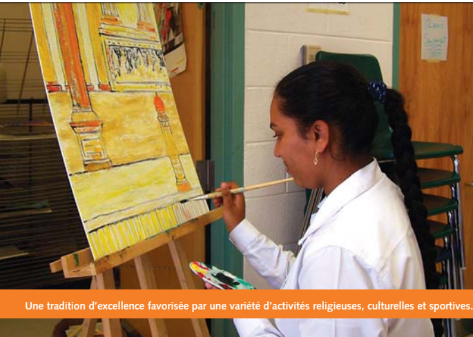
Une tradition d'excellence favorisée par une variété d'activités religieuses, culturelles et sportives.

C'est avec beaucoup d'enthousiasme que je vous accueille à notre école qui offre maintenant des cours de la 7 e à la 12 e année. En parcourant ce Prospectus, vous découvrirez un personnel exceptionnel, compétent et dévoué qui saura vous guider sur la voie du succès pendant vos quatre années chez nous. Vous serez fiers d'être un Cougar !