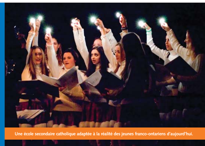
Une école secondaire catholique adaptée à la réalité des jeunes franco-ontariens d'aujourd'hui.

1780, boulevard Meadowvale Mississauga ON L5N 7K8 ☎ 905.814.0318 • 📠 905.814.8480 drousselle@csdccc.edu.on.ca www.ste-famille.com